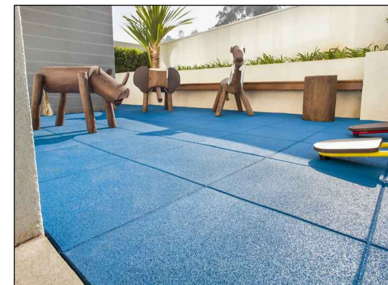
05 IMAGEM DO PISO PLAYGROUND

Play Eco 702 Área necessária: 13,50m x 12,00 m (162m 2 aproximadamente); Acompanha: Playground Ecológico contendo 1 Torre com cobertura rotomoldado redonda alt. Pat. 1,80m, 1 Torre com cobertura rotomoldado quadrada alt. pat. 1,40m, 2 Torre com cobertura rotomoldado decorativo alt. pat. 1,40m, 2 Torre sem cobertura com coqueiro decorativo alt. pat. 1,40m, 1 Passarela Tubo em desnível - H0,40m, 1 Escorregador caracol - H1,40m + 1 Plataforma Auxiliar + 02 Alamedas, 1 Escorregador simples 2,80m - H1,40m, 1 Escorregador Duplo - H1,40m, 1 Escorregador Curvo - H1,20m, 1 Escada 6 degraus - H1,40m, 1 Rampa escalada rotomoldada - H1,40m, 1 Rampa de Cordas - H1,40m, 1 Passarela Reta com guarda corpo, 1 Passarela Negativa com guarda corpo, 1 Escada Curvada - H1,40m, 1 Escada 1 degrau - H0,40m, 1 Flor decorativa, 4 Guarda corpo rotomoldado, 1 Fechamento Jogo da velha, 1 Balanço anexo a torre com 2 assentos (2 infantis).