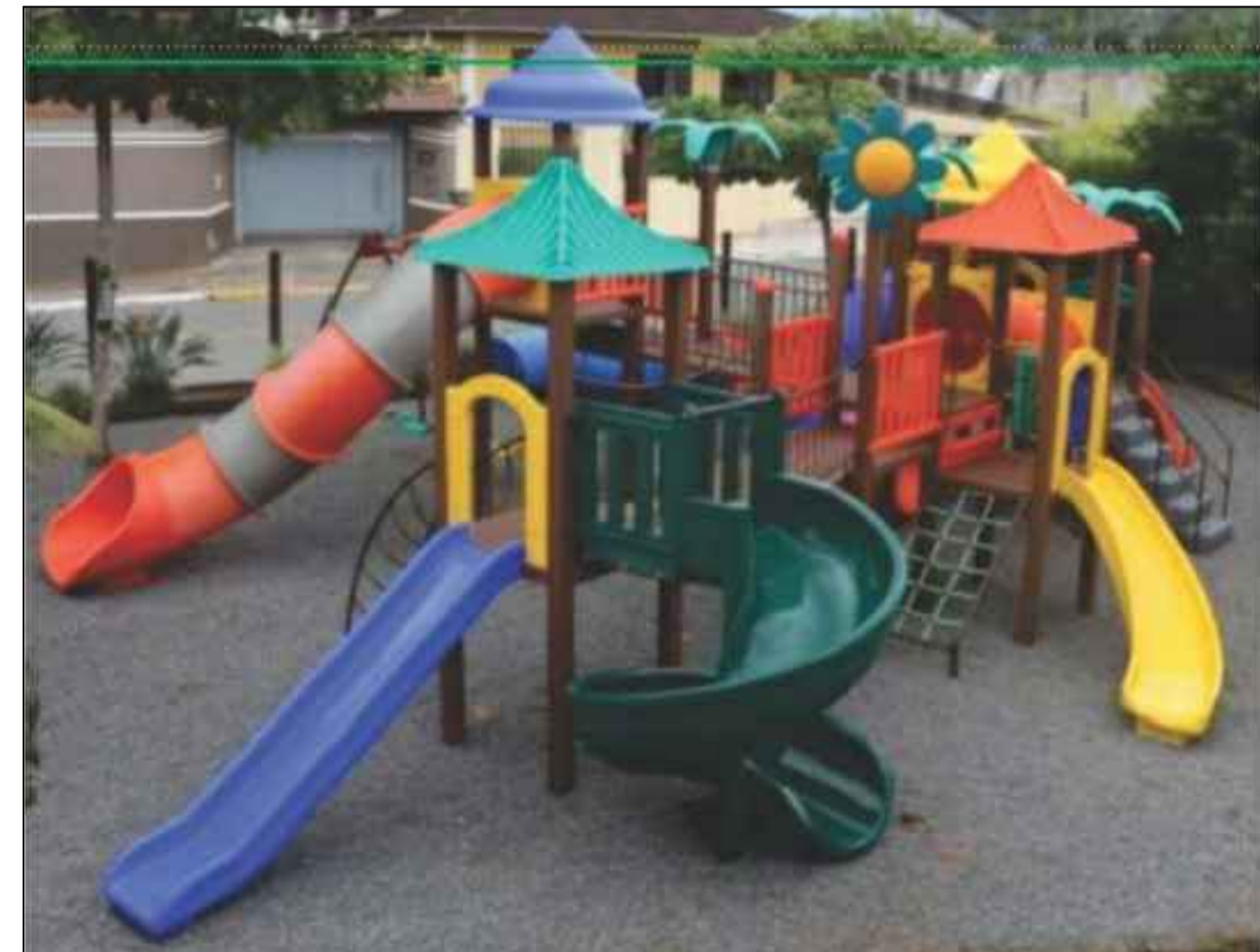
03 IMAGEM DO PLAYGROUND