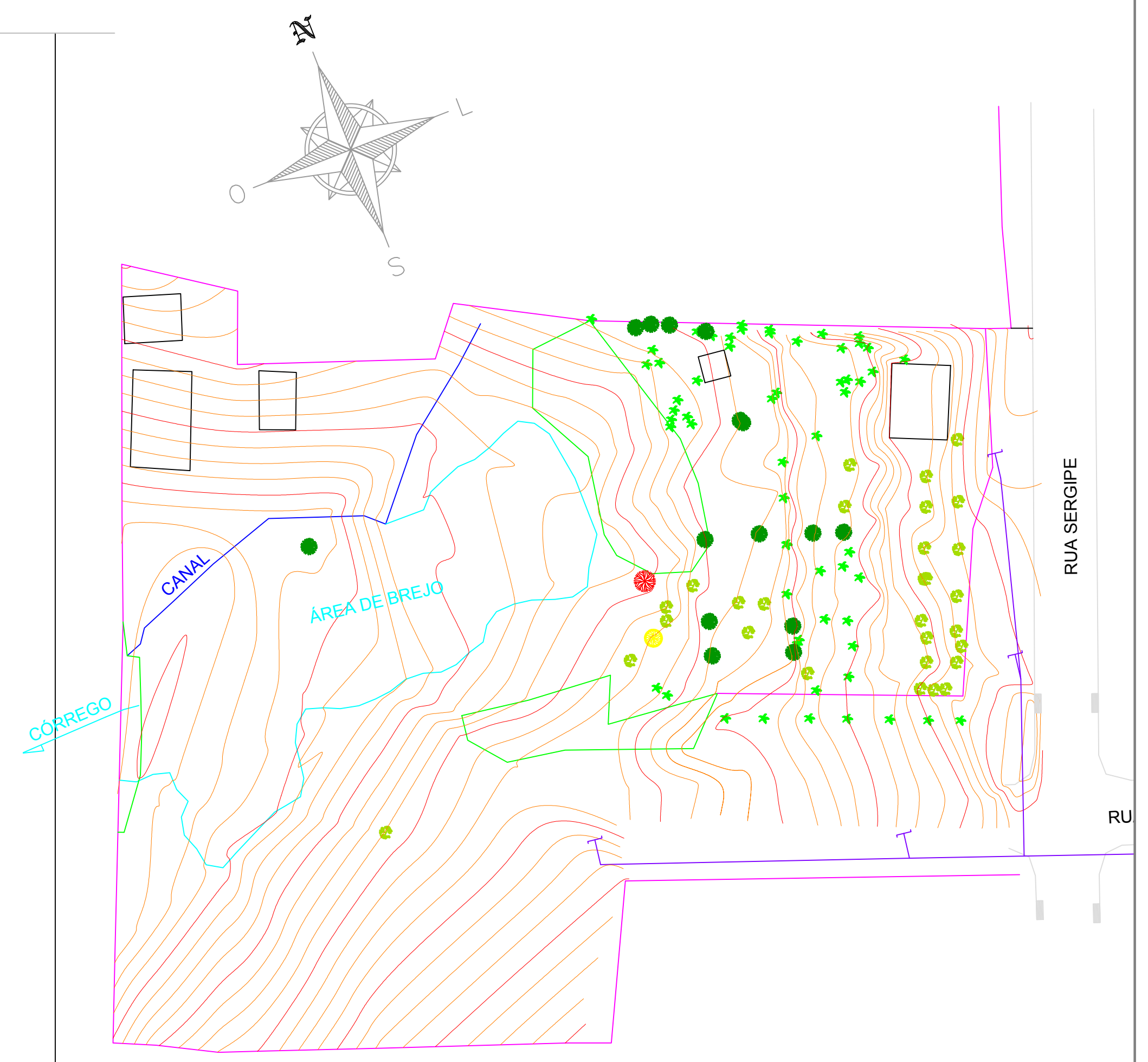
02 PLANTA DE LOCAÇÃO DAS ÁRVORES EXISTENTES ESCALA 1/500